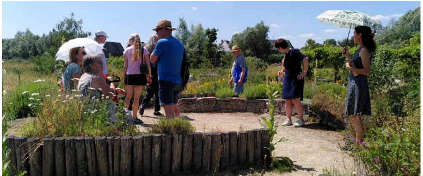
Voedselbos Brummen, ontwikkeld met en onderhouden door bewoners

De wijk- en dorpsraden verschillen sterk van karakter, in de rol en taken die ze voor zichzelf zien. Voor de gemeente vormen de wijk- en dorpsraden een vaste gesprekspartner als het gaat om plannen en beleid in hun dorp of gebied. In de komende jaren willen gemeente en wijk- en dorpsraden de onderlinge samenwerking meer gaan structureren, op een manier die past bij de individuele wijk- en dorpsraad.