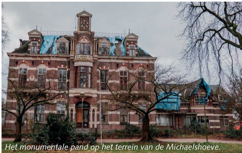
Het monumentale pand op het terrein van de Michaelshoeve.

Op donderdagen 6 en 13 februari is gemeente Brummen telefonisch niet bereikbaar in verband met opleidingsdagen. Heeft u een dringende vraag of spoedmelding? Kijk dan eerst op onze website of daar de informatie staat die u nodig heeft. Staat de informatie er niet bij, dan kunt u ons bereiken via info@brummen.nl op die donderdagen. Het gemeentehuis is op deze dagen open. U kunt langskomen voor bijvoorbeeld het afhalen van documenten. De volgende dag, op vrijdag, zijn wij weer zoals gebruikelijk telefonisch bereikbaar. Bedankt voor uw begrip!