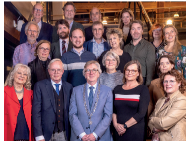
De gemeenteraad wenst iedereen een gezond en gelukkig 2025.