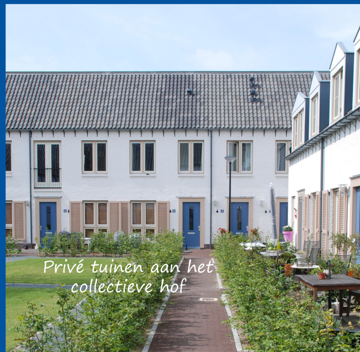
Privé tuinen aan het collectieve hof