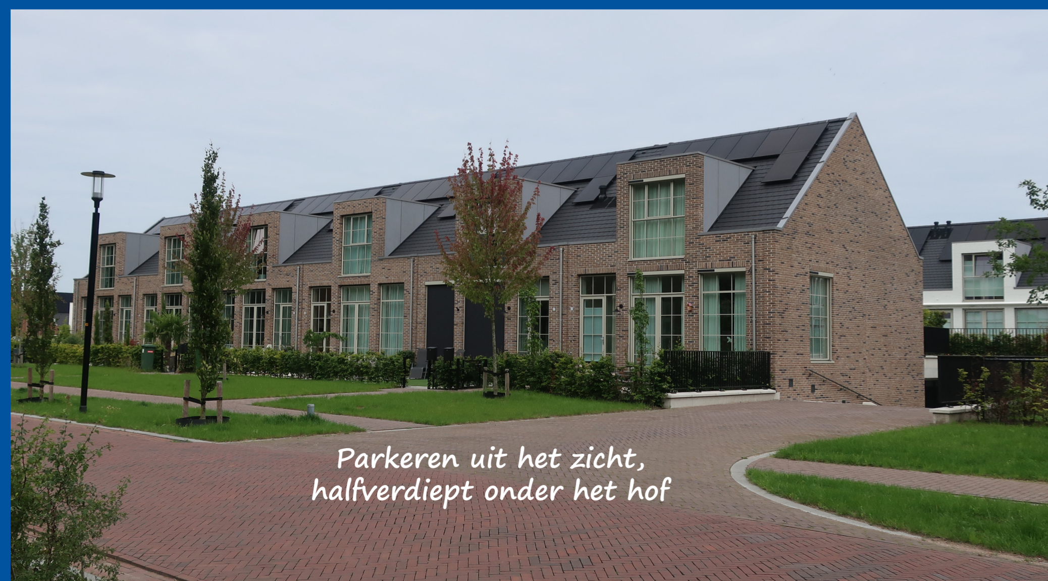
Parkeren uit het zicht, halfverdiept onder het hof