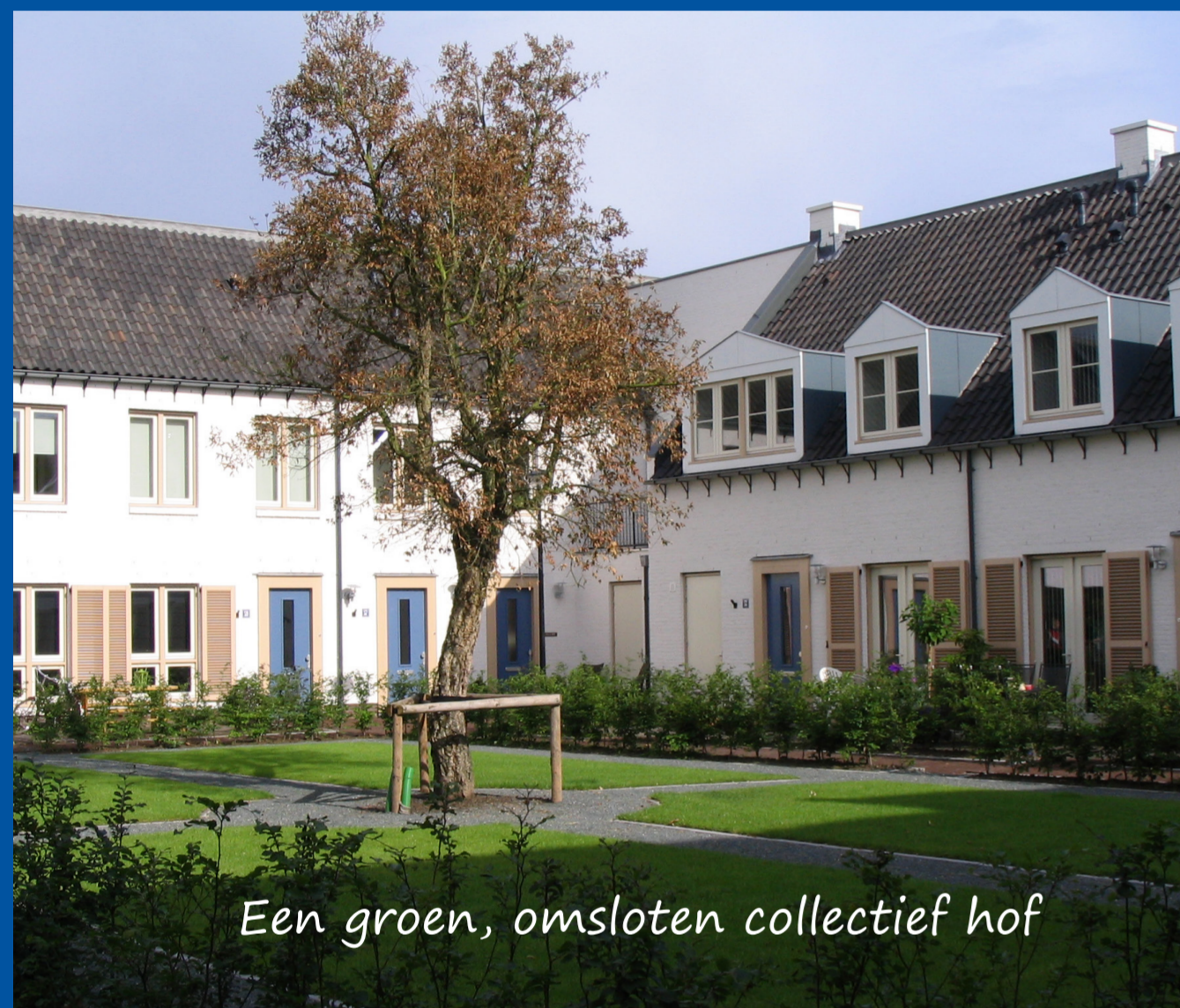
Een groen, omsloten collectief hof