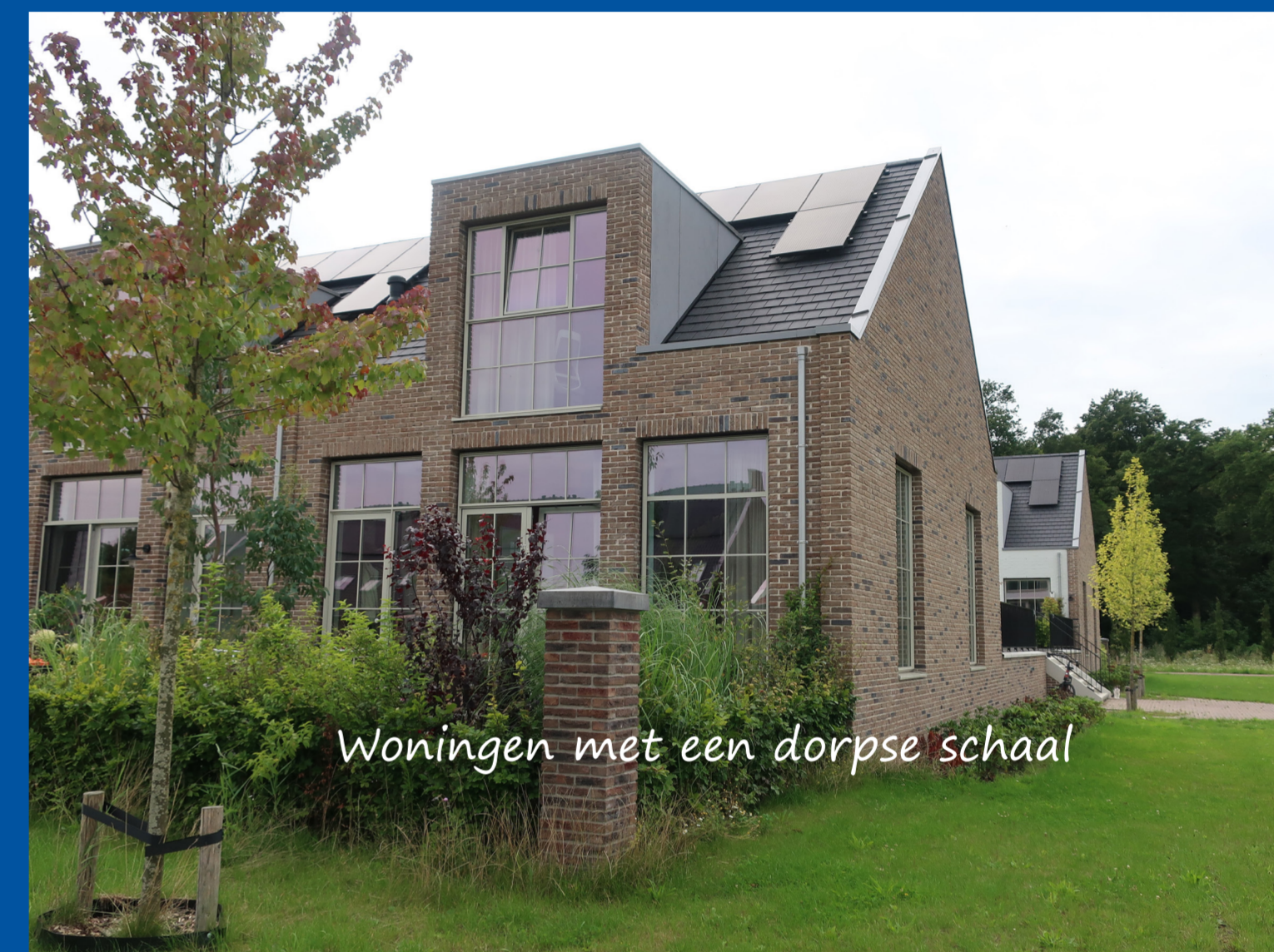
Woningen met een dorpse schaal