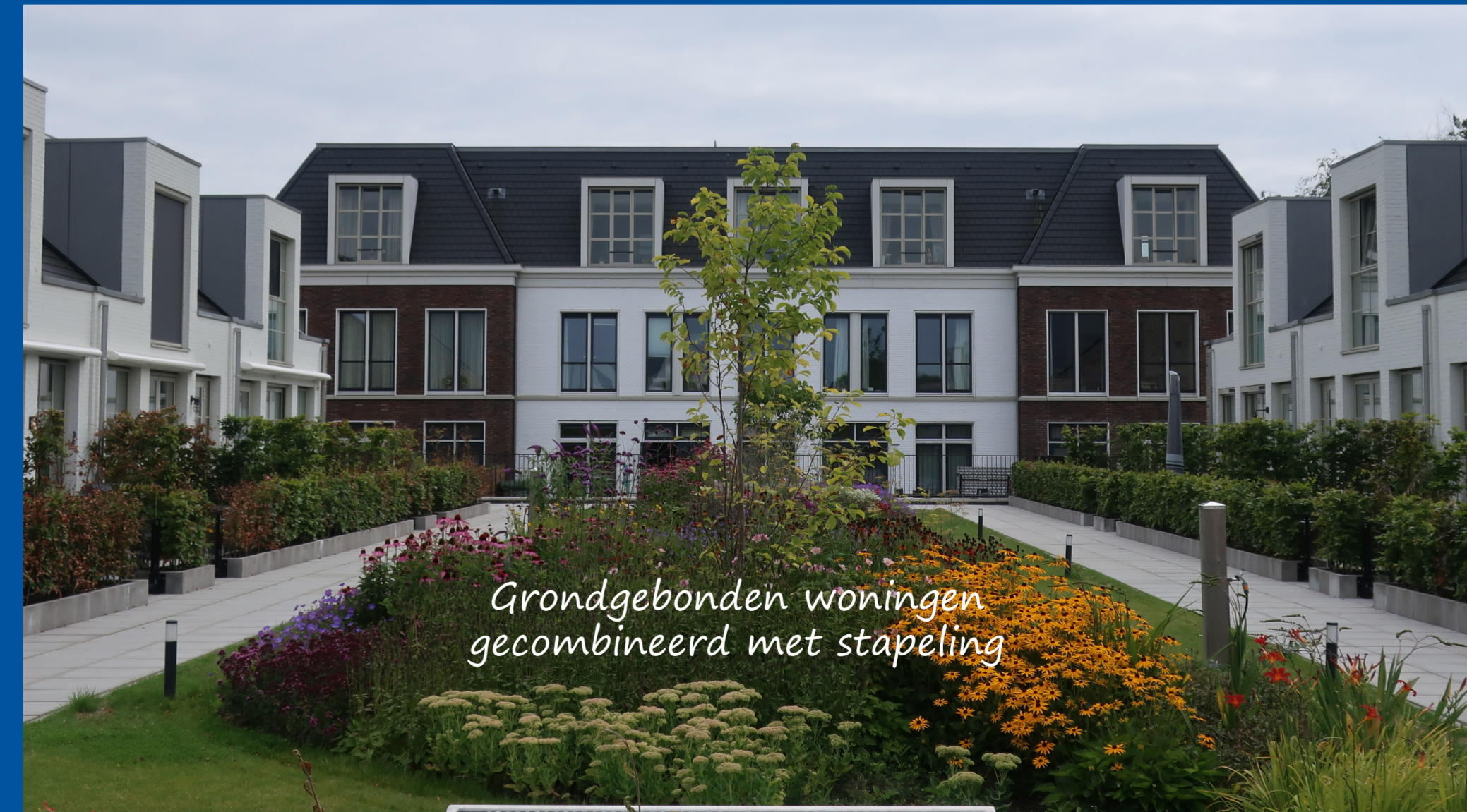
Grondgebonden woningen gecombineerd met stapeling