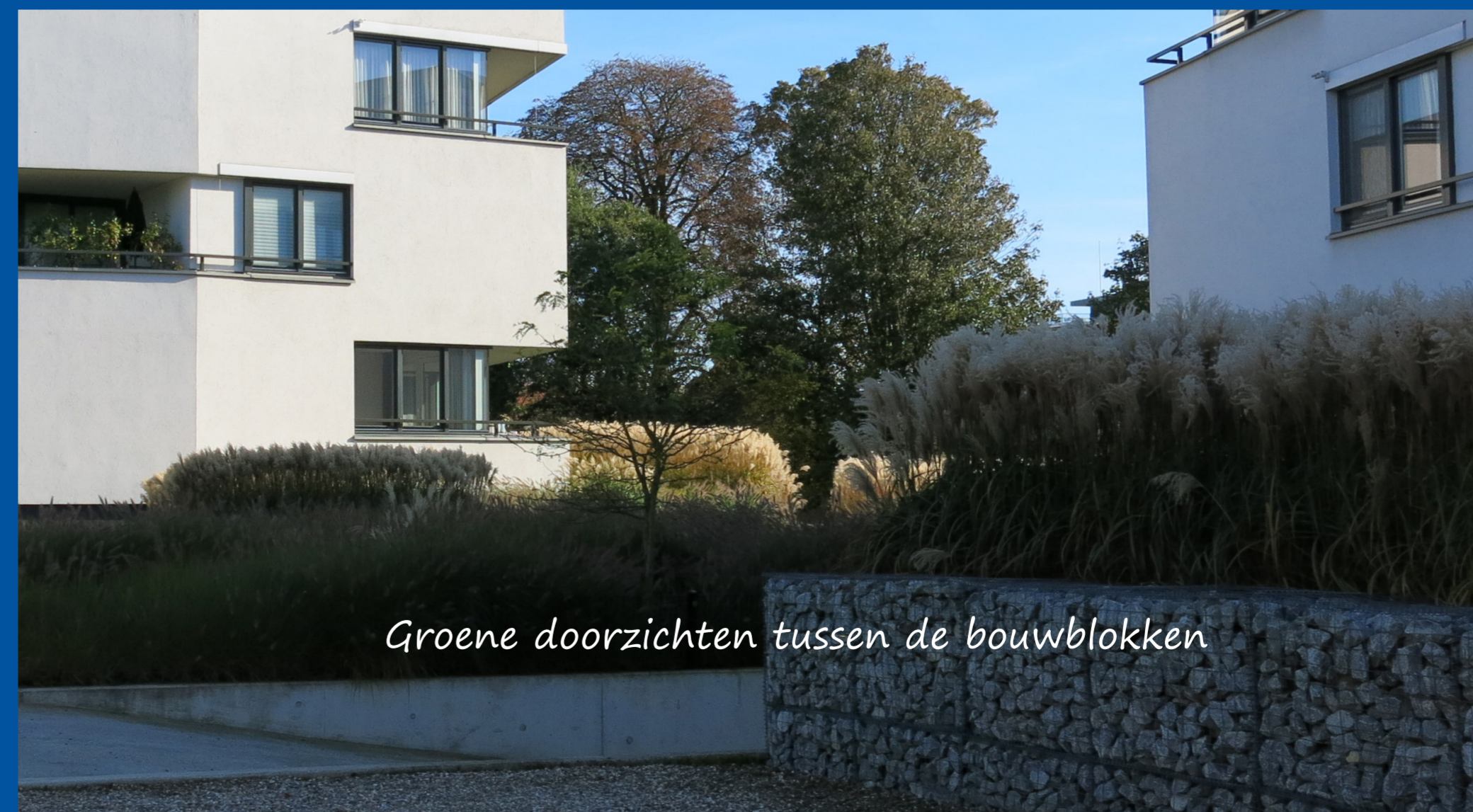
Groene doorzichten tussen de bouwblokken