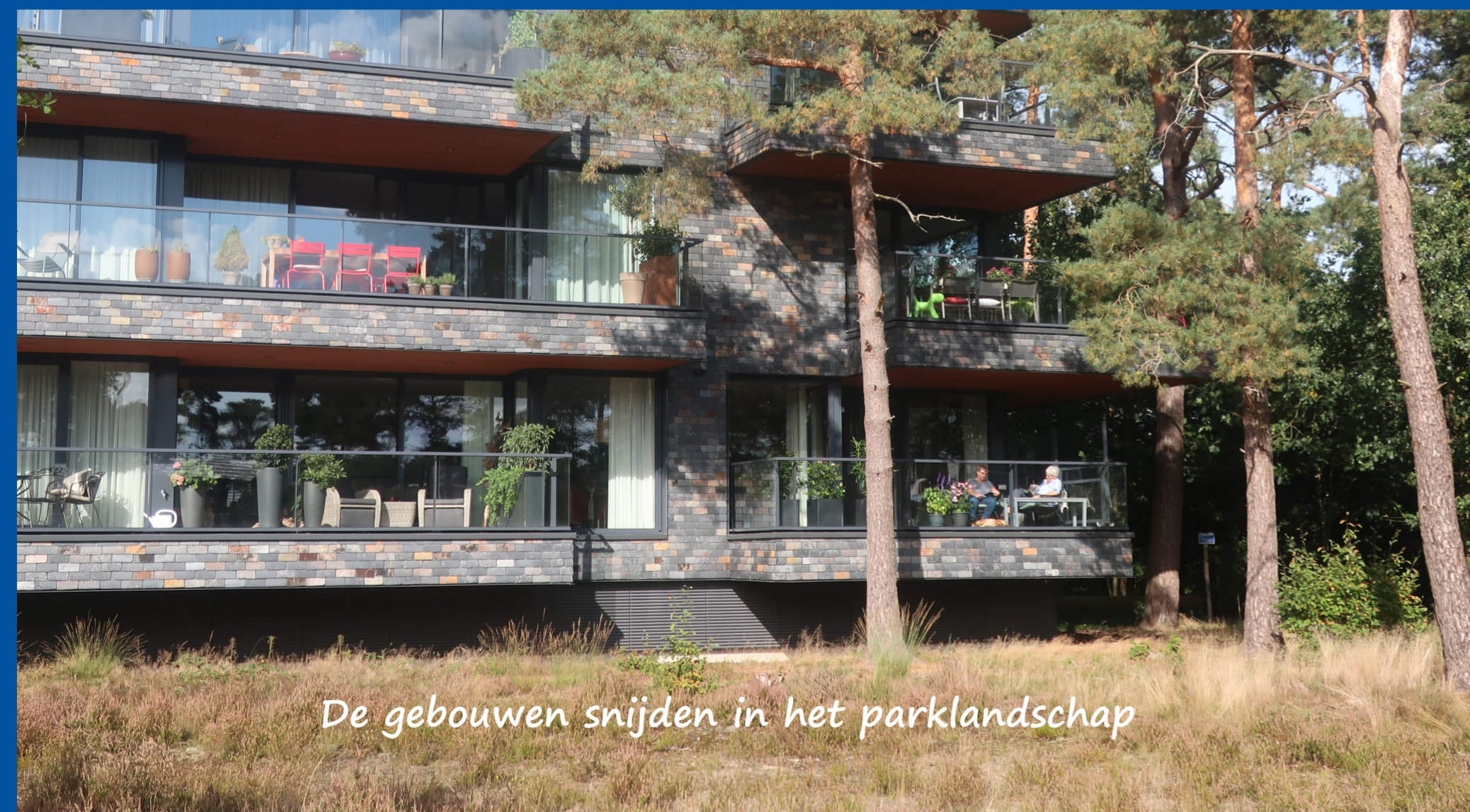
De gebouwen snijden in het parklandschap