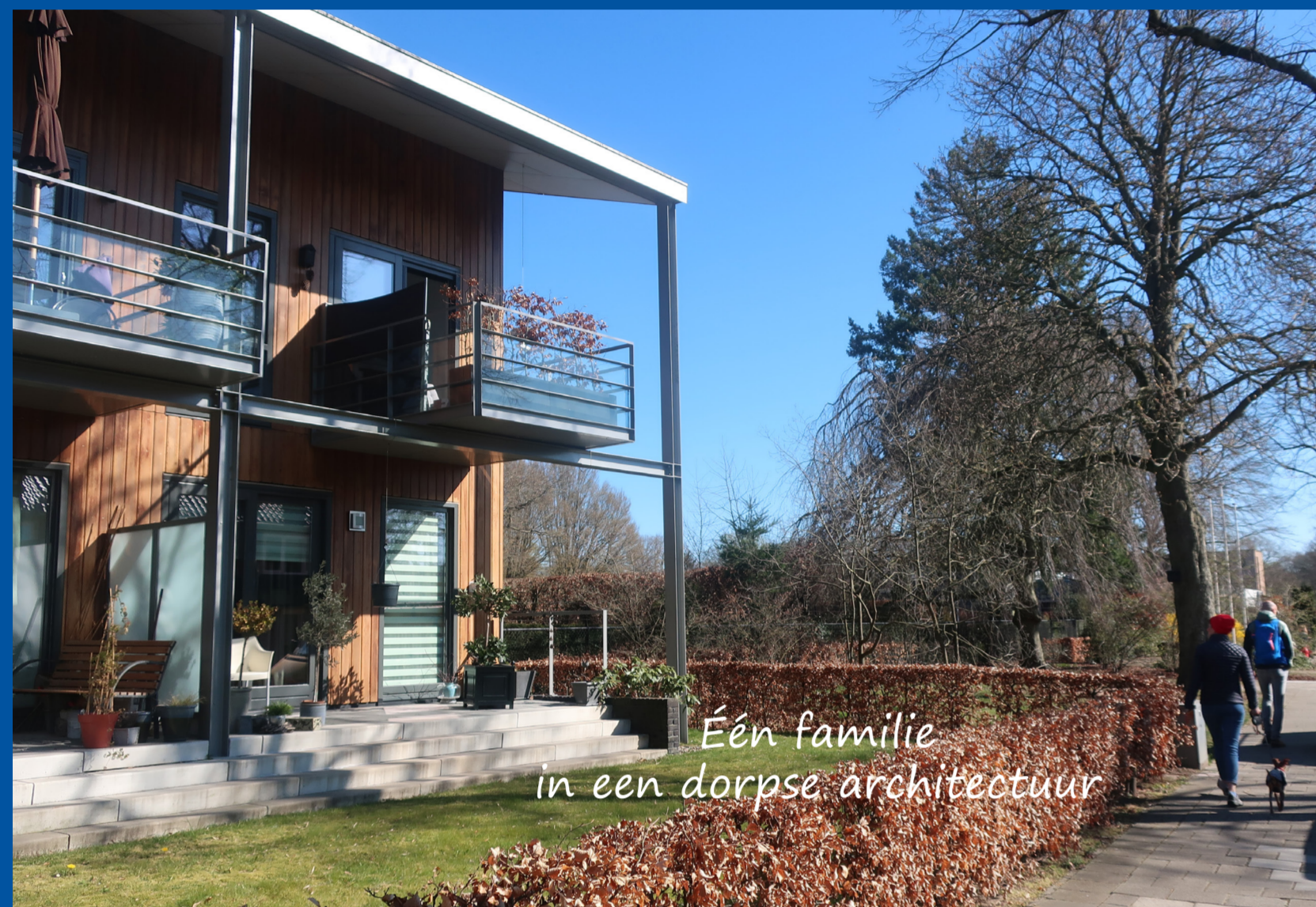
Eén familie in een dorpse architectuur