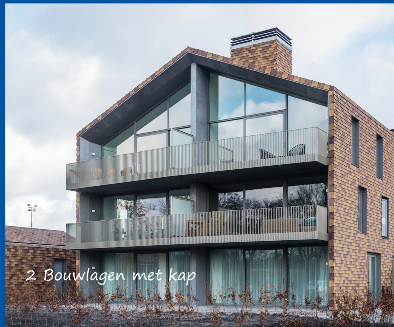
2 Bouwlagen met kap