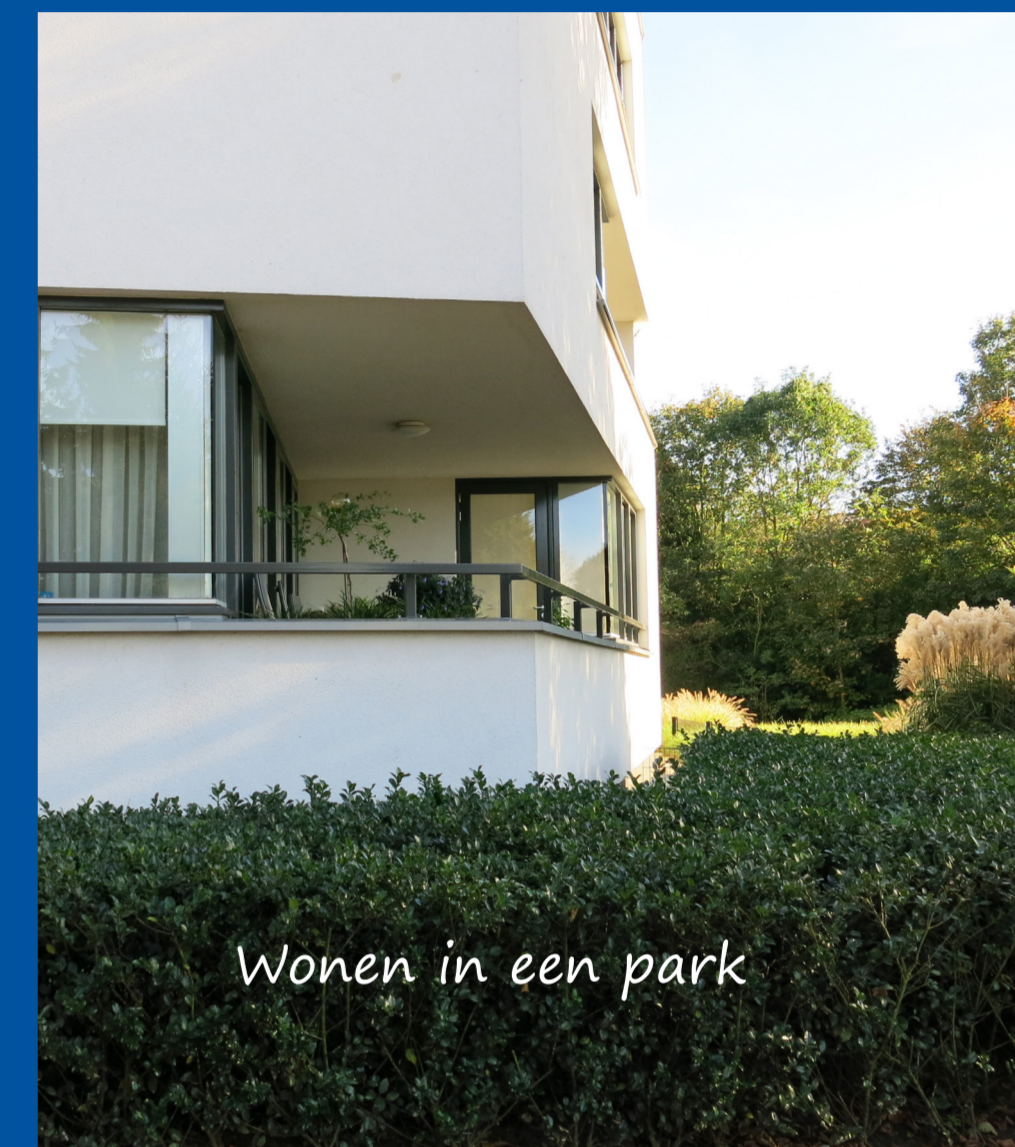
Wonen in een park