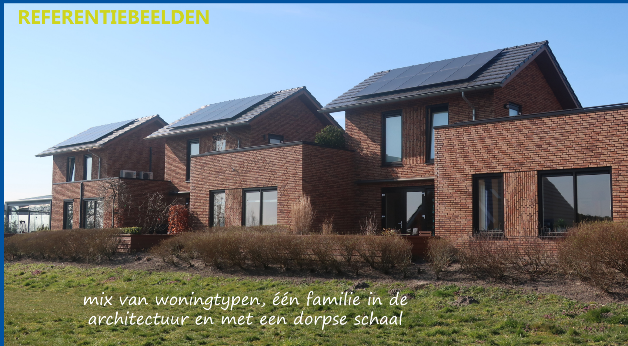
mix van woningtypen, één familie in de architectuur en met een dorpschaal