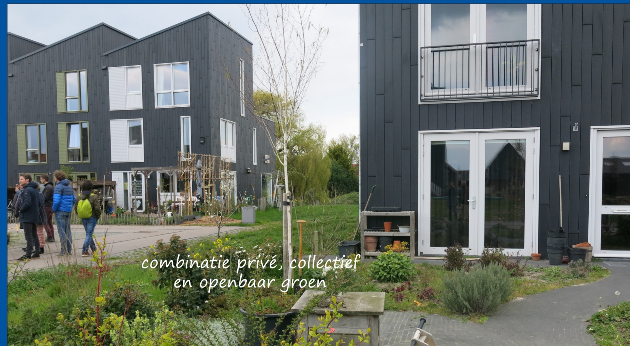
combinatie privé, collectief en openbaar groen