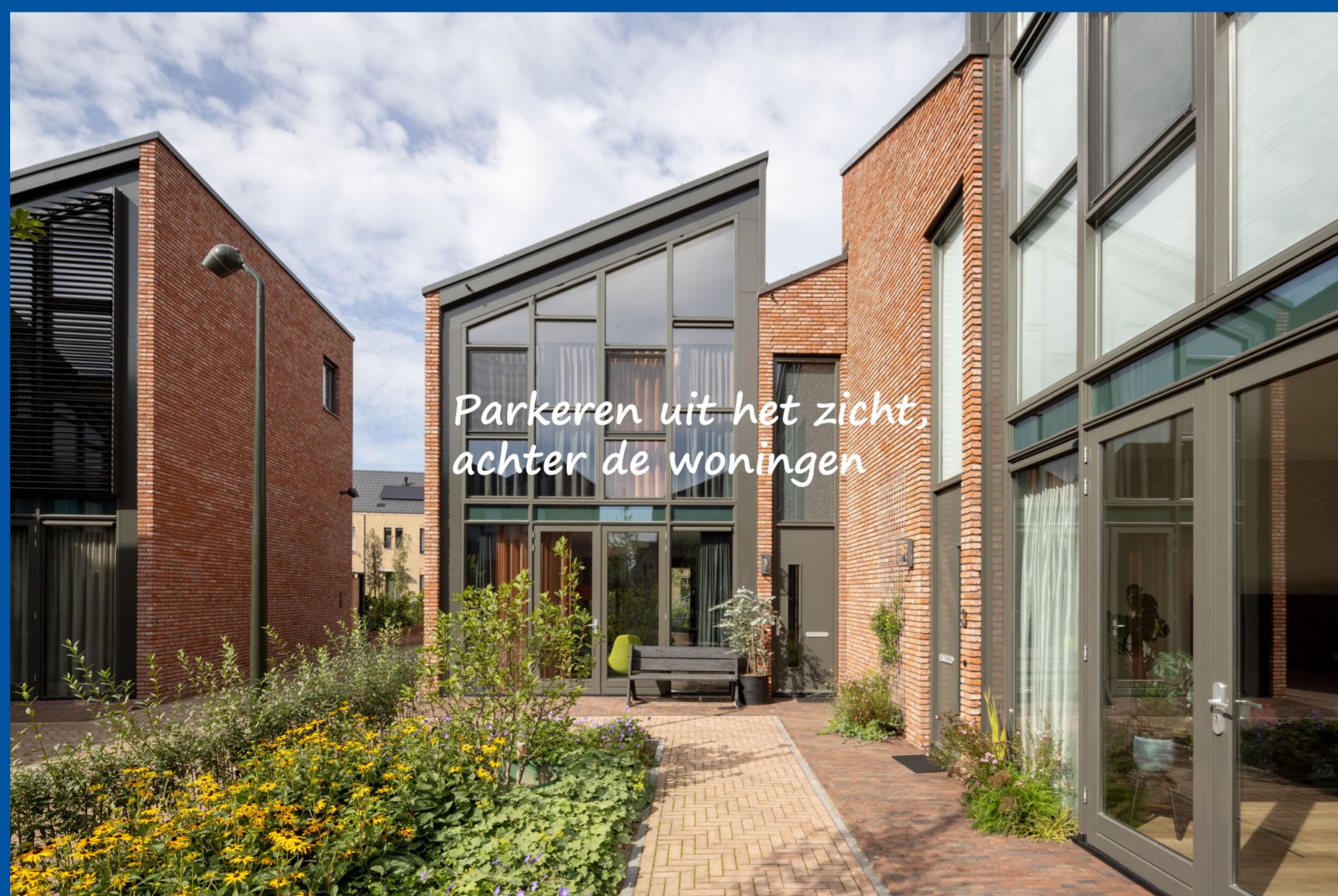
Parkeren uit het zicht, achter de woningen