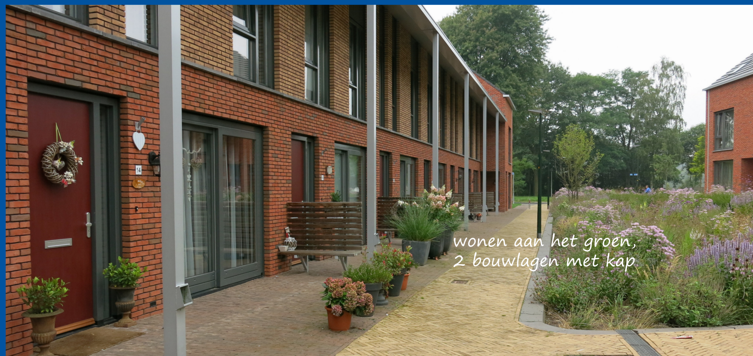
wonen aan het groen, 2 bouwlagen met kap